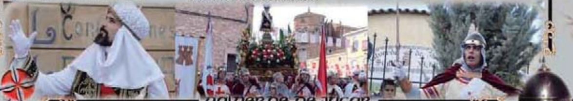
COLODOE DE JUCAR

¡Gracias a Alá, mahometanos que por fin llegó el momento de manchar el pavimento con sangre de los cristianos!.